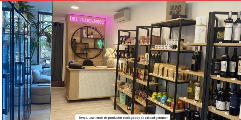
Terrae, una tienda de productos ecológicos y de calidad gourmet