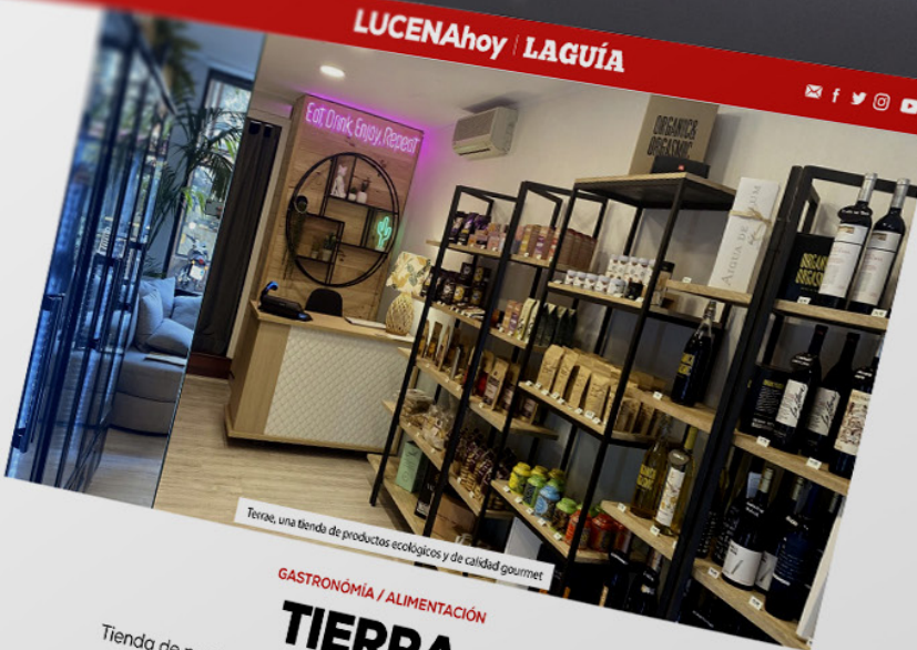
Tierra, una tienda de productos ecológicos y de calidad gourmet